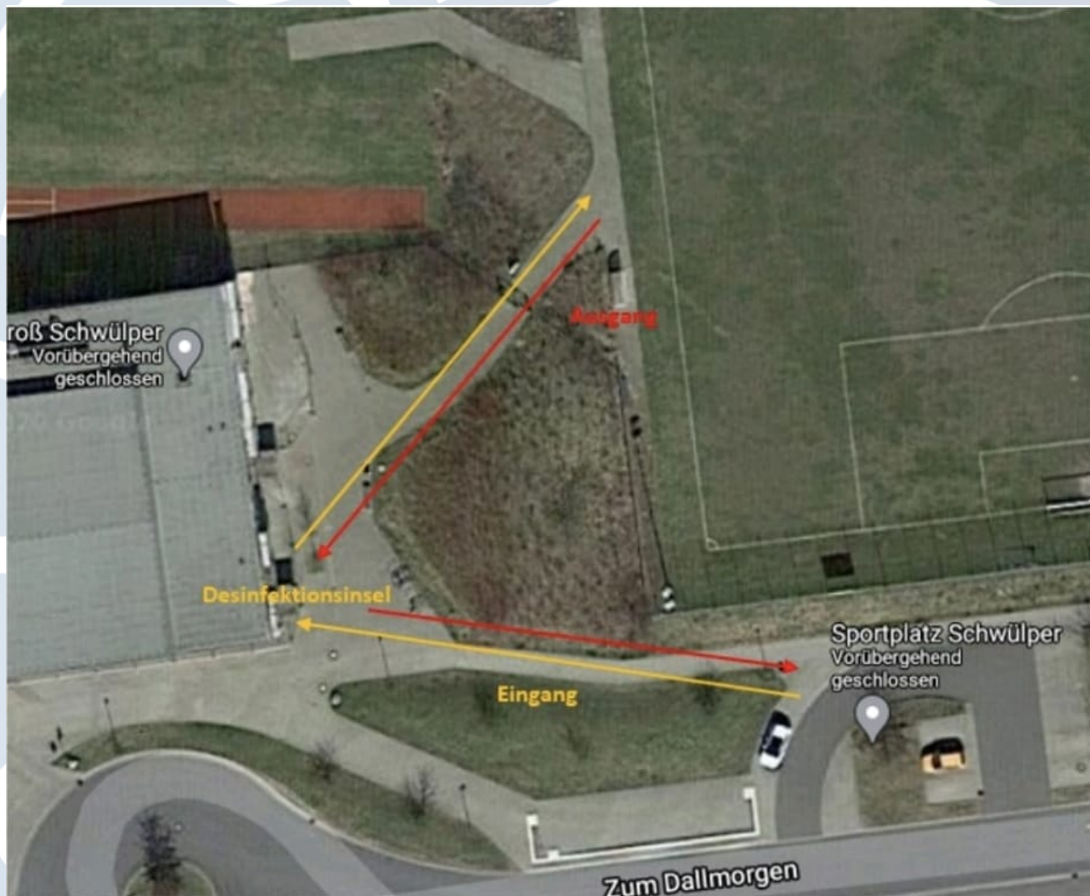
Am Beispiel OBS Sportplatz Schwülper